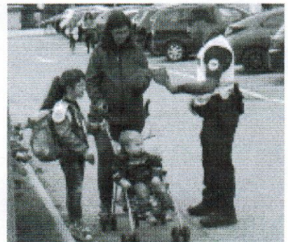
A pied à l'école - voici le bon exemple à suivre